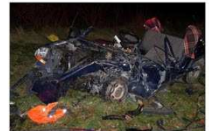
Un Saint-Vallierois âgé de 60 ans a trouvé la mort hier soir dans une violente collision entre Charntemerles-Blés et Claveyson. Une jeune femme, également domiciliée à Saint-Vallier, a été grièvement blessée.