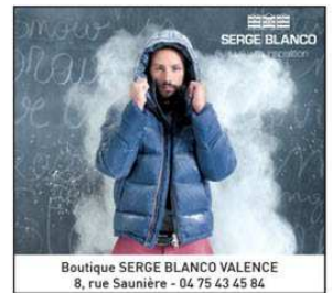
Boutique SERGE BLANCO VALENCE 8, rue Saunière - 04 75 43 45 84