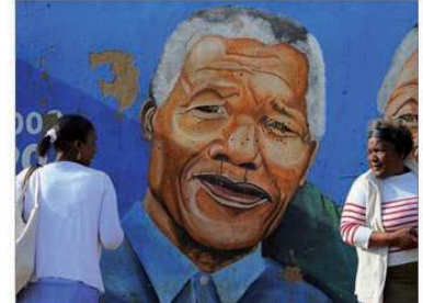
Nelson Mandela est l'objet d'un véritable culte dans son pays.