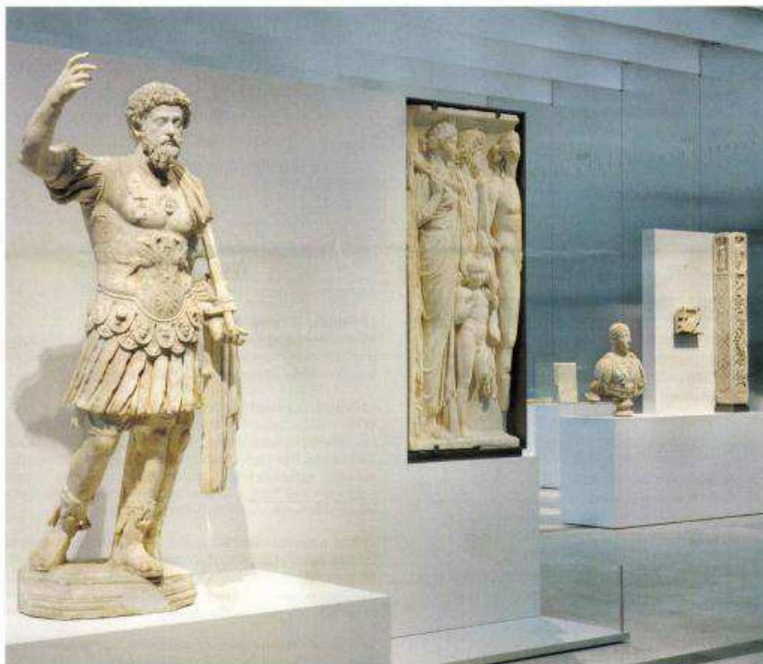
Vue de la galerie du Temps, Louvre-Lens. © Kazuo Sejima + Ryue Nishizawa / SANAA, Finn Culbert + Coko Inroy / WREY CULBERT, Catherine Mosbach/Museographie - Studio Adrien Gardère.

Cette sculpture en marbre de l'empereur Marc Aurèle est l'un des chefs-d'œuvre qui ponctuent la galerie du Temps, le parcours semi-permanent du Louvre-Lens ■ Le 12 décembre, le public pourra découvrir cet accrochage exceptionnel au sein de l'édifice éphémère conçu par les architectes japonais de Sanaa ■ L'exposition temporaire inaugurale retrace quant à elle les révolutions de la Renaissance en quelque 250 œuvres Pages 19 à 24