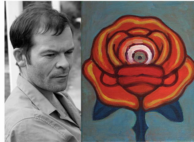
La rose, 27 x 22 cm, acrylique sur toile, 2017