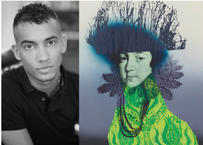
Le sultan - détail, 110 x 80 cm, acrylique et sérigraphie sur toile, 2018

Guillaume Pinard est né en 1971 et basé à Rennes. Se glisser dans un jargon pour le corrompre et y inventer sa place. ddab.org/pinard