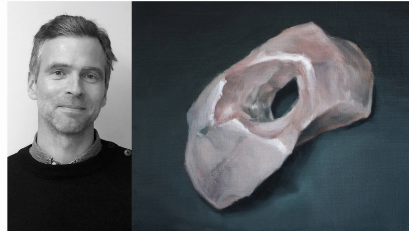
Art moderne, 24 x 30 cm, huile sur toile, 2012 © L'artiste

Raphaël Barontini est né en 1984 et basé à Saint-Denis. Écrire avec fougue sa propre Histoire à partir d'éléments insulaires. www.raphaelbarontini.com