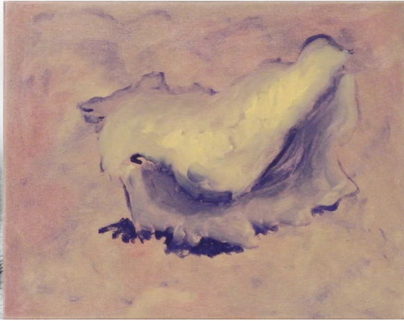
Shell, 19 x 24 cm, huile sur toile, 2019 © L'artiste, portrait par Jean-Marc de Samie

Hugo Pernet est né en 1983 et basé à Dijon. Laisser traîner son pinceau avec un éclair en tête lorsqu'on veut peindre un orage. www.hugopernet.com