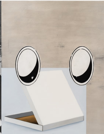
Dans L'Angle, 130 x 100 cm, huile, tempera et acrylique sur toile, 2018 © L'artiste et les galeries Gregor Podnar (Berlin), Greta Meert (Bruxelles) et Valentin (Paris), photo Gregory Colpittet

Anne Neukamp est née en 1976 et basée à Berlin. Articuler des formes sur une surface picturale la plus plane possible. www.aneukamp.com